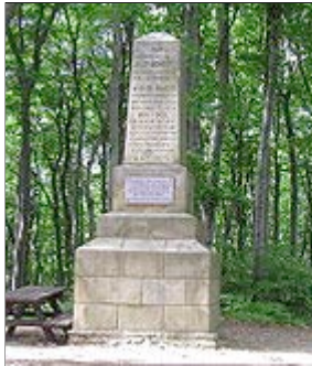
oben: Denkmal in Purkersdorf Obelisk auf dem Schöffelstein