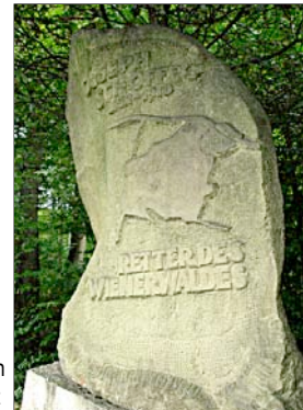
Auch in Gablitz steht ein Gedenk-Stein am Klosterweg