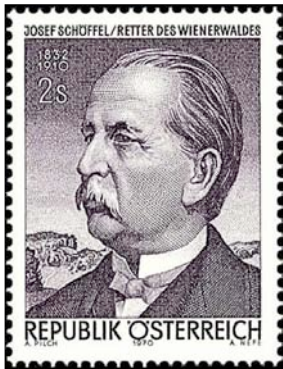
Briefmarke 1970: zum 60. Todestag