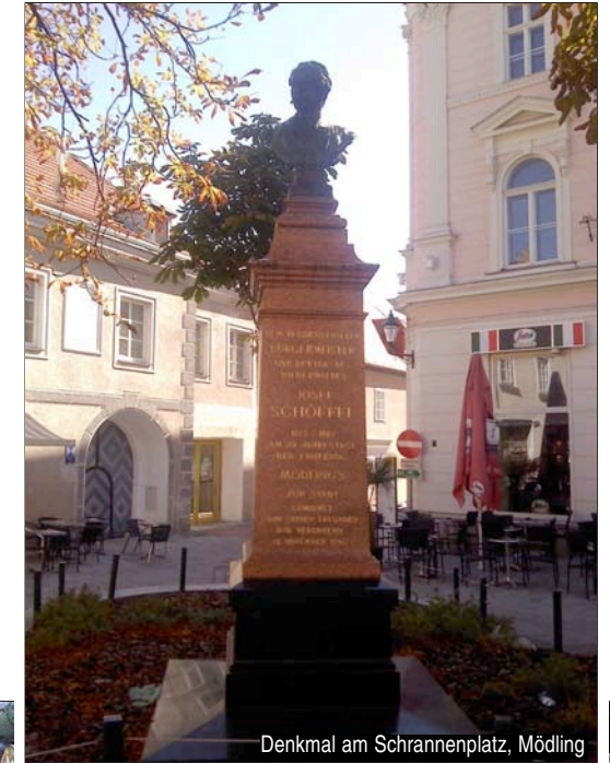
Denkmal am Schrankenplatz, Mödling