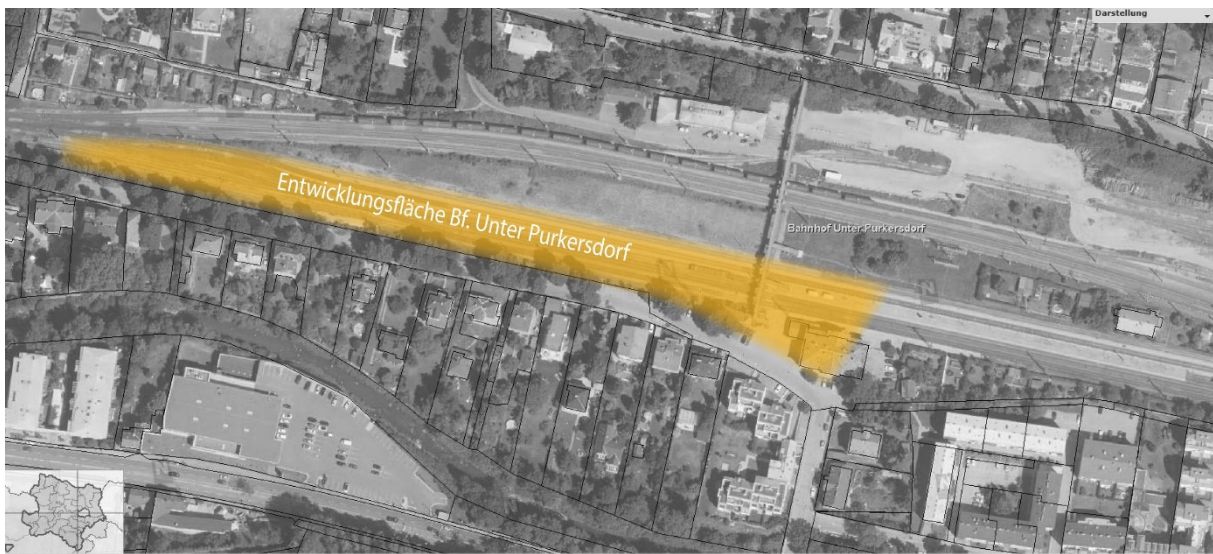
Abbildung 1:

Gemeinsam sind wir überzeugt, dass durch die Entwicklung des neuen Stadtquartiers ein positiver und nachhaltiger Mehrwert entstehen kann.