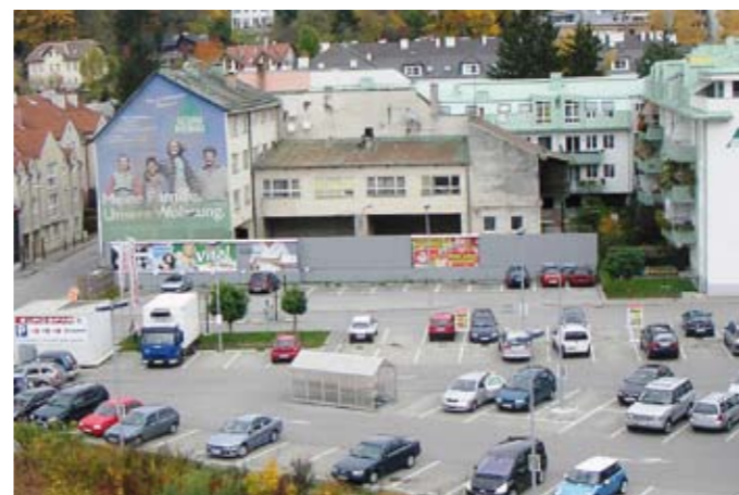
Herrengasse 6 im Altzustand 2008

Er spielt hier mit der Angst der Mieter! Und schützt weiter die Genossenschaften!