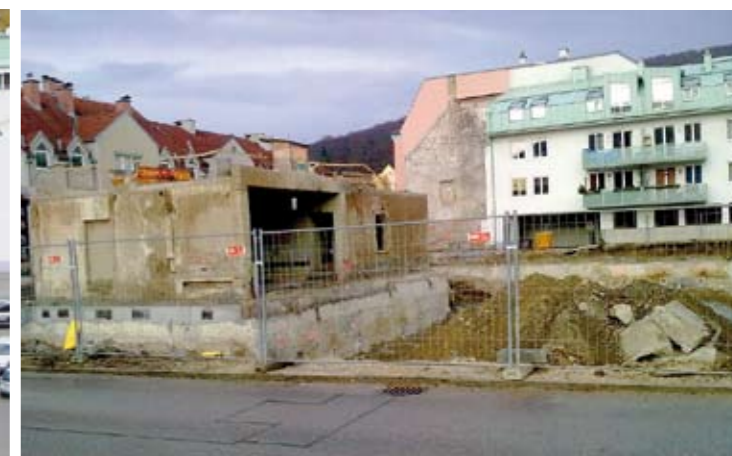
Die Mauer der Einfahrt blieb stehen wegen der „Althausanierung“