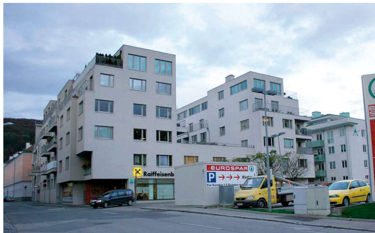
Der Neubau umfasst 39 Wohnungen, die Polizei, eine Bankfiliale