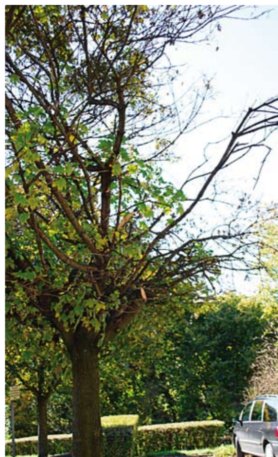
Gegenüber einer Baustelle in der Hardt-Stremayr Gasse wurde ein Drittel der Krone weggerissen