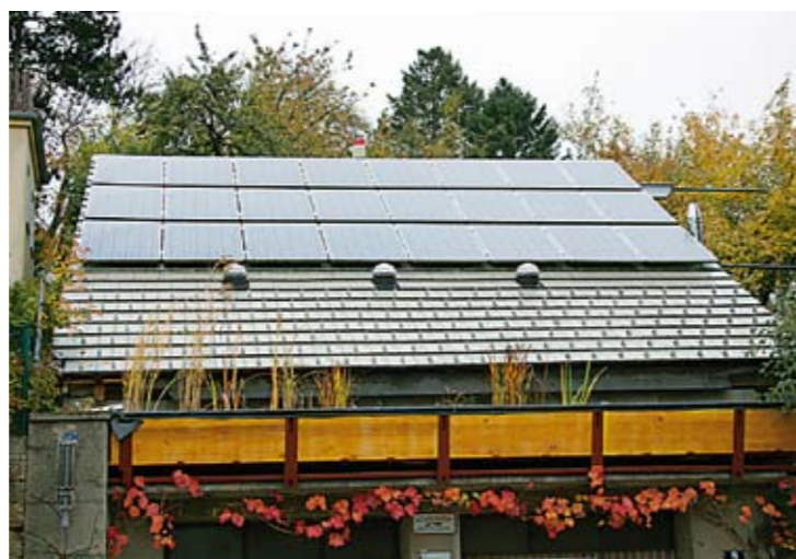
PV-Anlage in Purkersdorf, so eine fehlt derzeit noch auf den Dächern des Rathauses und des Stadtsaals