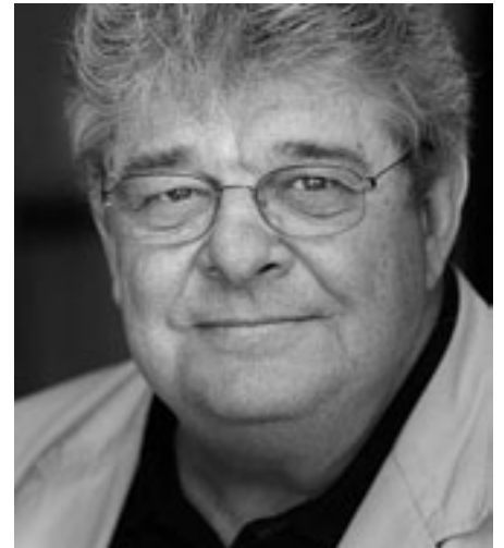
Familientherapeut Jesper Juul

3. Ist es schlichte Unwissenheit und Unkenntnis der agierenden Mandatäre (ignorant)? (Da kann der Literaturtip Abhilfe schaffen.)