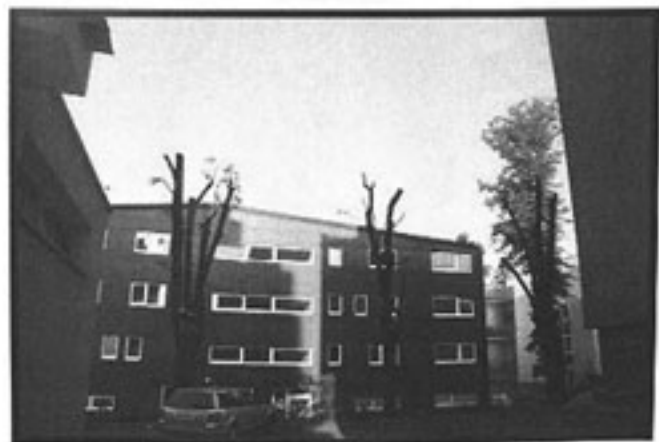
† Nachher †