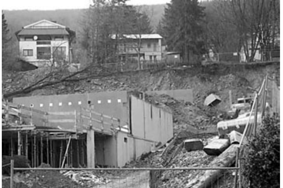
Hangrutschung in der Wintergasse

Irgendwie deutet in letzter Zeit einiges darauf hin, dass der Grund für den verhängten Baustopp für Bauten jenseits von Ein- bis Zweifamilienhäuser einfach nur der ist, dass der Herr Bürgermeister weniger Wirbel um die vielen Bauten haben möchte. Dieser Stopp wird genau bis zur nächsten Wahl in 2 Jahren dauern damit dann alles so weiter wie