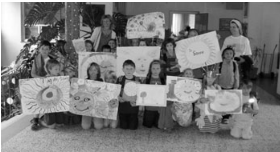
Die Montessori-Mehrstufen-Klasse präsentierte stolz ihre Arbeiten zum Thema Sonnenenergie

Die Sonne steht dabei selbstverständlich immer im Mittelpunkt.