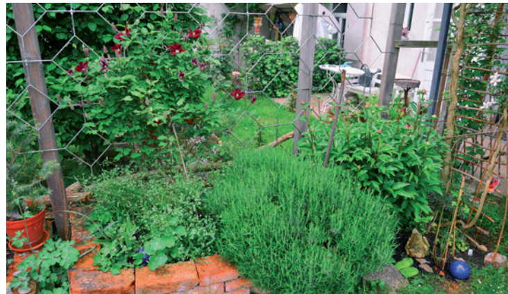
Vielfalt auf kleinem Raum; gemeinsam gestaltet wächst sie bunter und fröhlicher.

Paradeiser & Co in Balkonien. Etwa den Bio-Balkongarten, wo durch geschicktes Planen und der Auswahl der richtigen Pflanzensor-