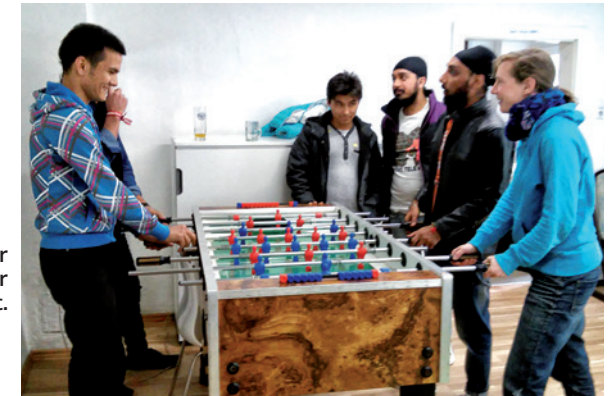
Der Wuzzler ist ein großer Anziehungspunkt.