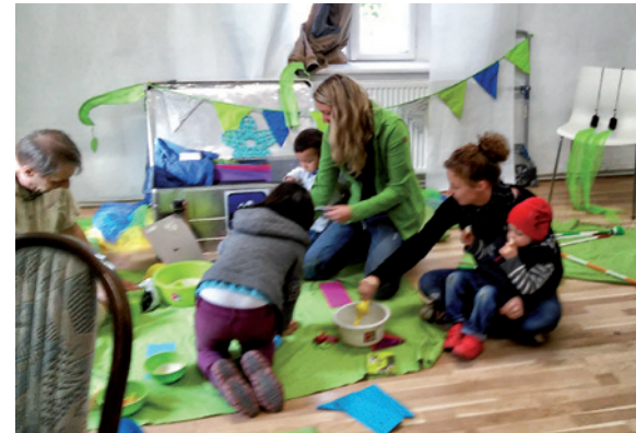
Der Spielekoffer begeistert Groß und Klein.