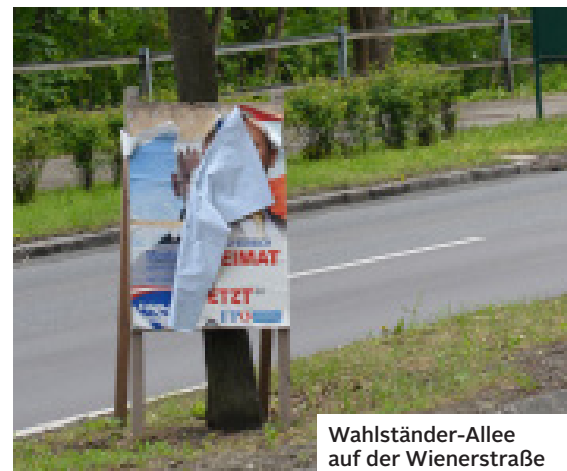
Wahlständer-Allee auf der Wienerstraße – oft mit schnellem Ablaufdatum ...

Die Hoffnung ist größer als die Angst. Diese Wahl kann wohl kaum eines der anstehenden Probleme für Österreich lösen, aber sie kann entscheidend die Richtung bestimmen: Blinde Angst ist kein guter